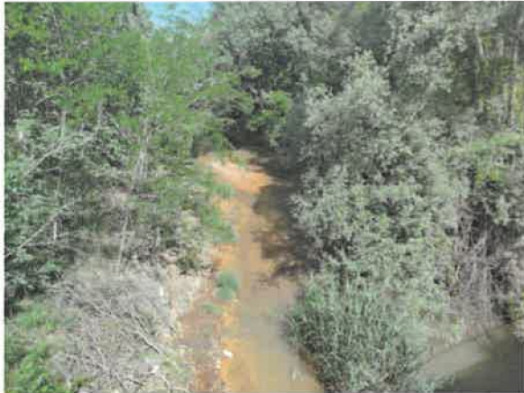
7. Бела река у Заграђу после улива Равне реке