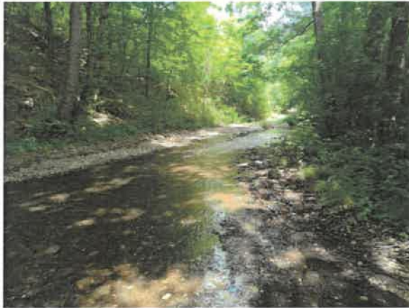
13. Брестовачка река после Брестовачке бање