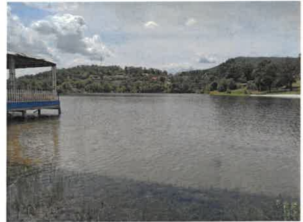
10. Борско језеро – Главна плажа