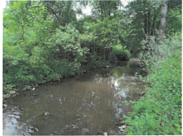
14. Брестовачка река у Цановом Пољу (после нископа)