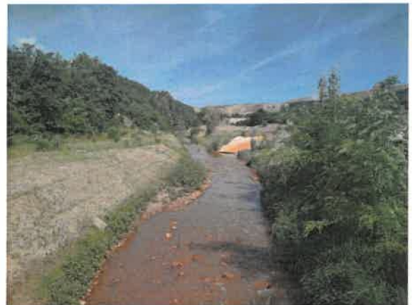
4. Борска река пре улива Кривељске реке из тунела