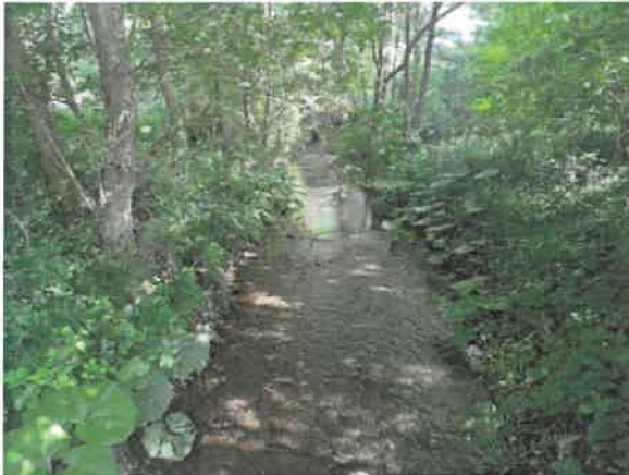
1. Кривељска река након спајања Церове реке и Ваља Маре