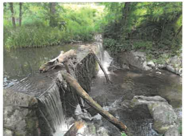
12. Брестовачка река пре Брестовачке бање