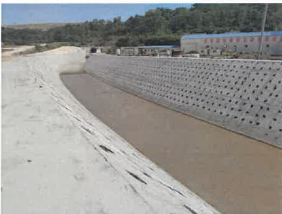
3. Кривељска река после излаза из тунела