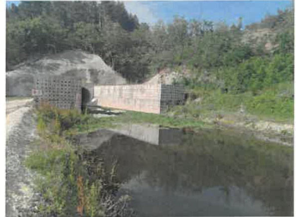
2. Кривељска река пре улаза у тунел