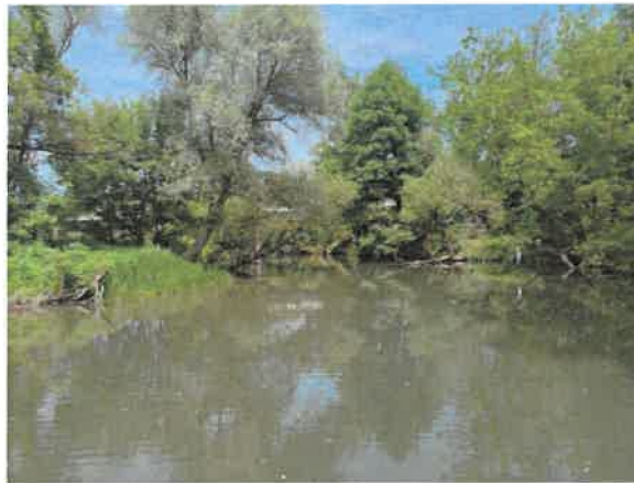
15. Црни Тимок после улива Брестовачке реке