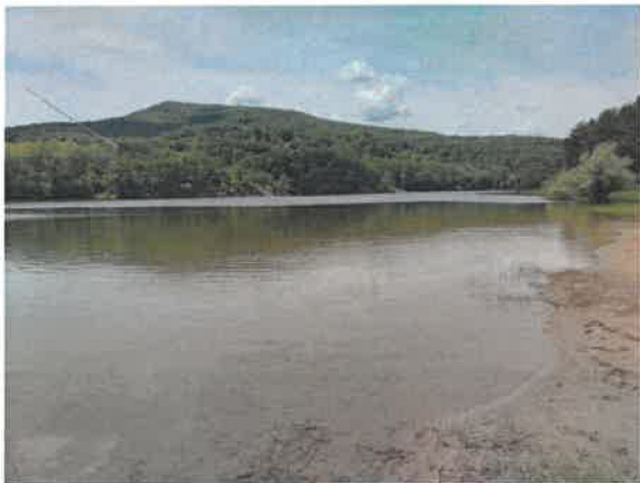
9. Борско језеро – плажа Тропски бар