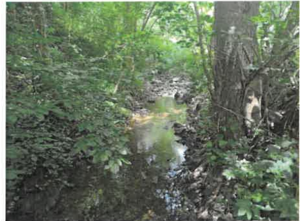
8. Борско језеро – притока Ваља Жони