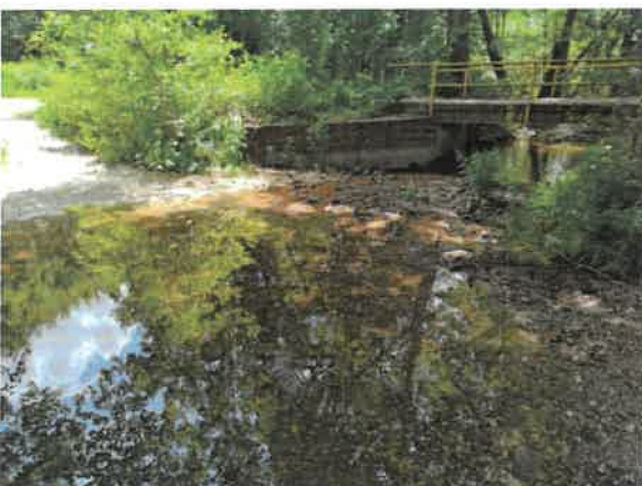
11. Борско језеро – притока Марцова река