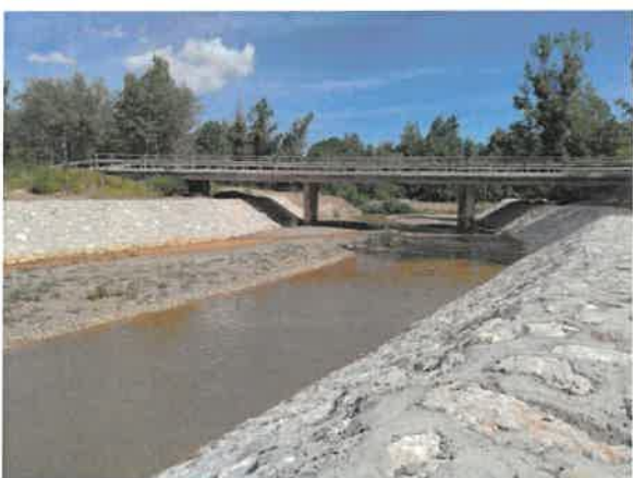
5. Борска река пре улива у Кривелску реку (старо корито)