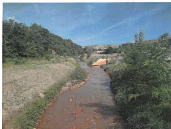
4. Борска река пре улива Кривелске реке из тунела