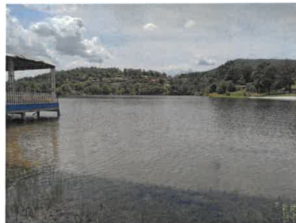
10. Борско језеро – Главна плажа