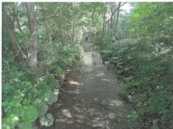
1. Кривелска река након спајања Церове реке и Ваља Маре