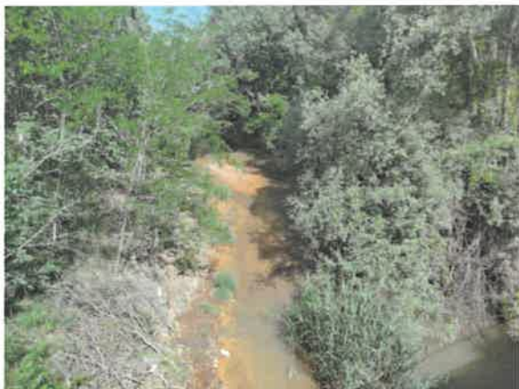
7. Бела река у Заграђу после улива Равне реке