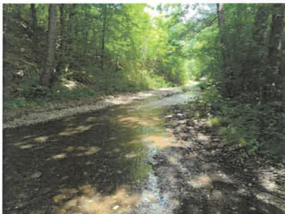
13. Брестовачка река после Брестовачке бање