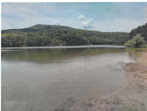
9. Борско језеро – плажа Тропски бар