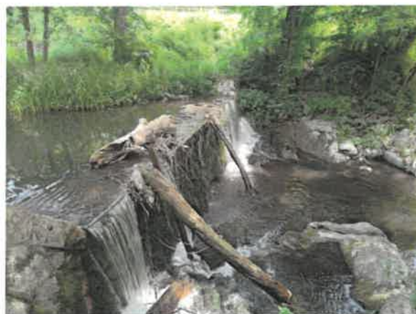
12. Брестовачка река пре Брестовачке бање