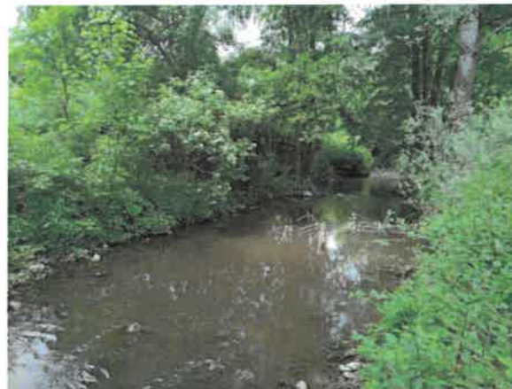
14. Брестовачка река у Цановом Пољу (после нископа)