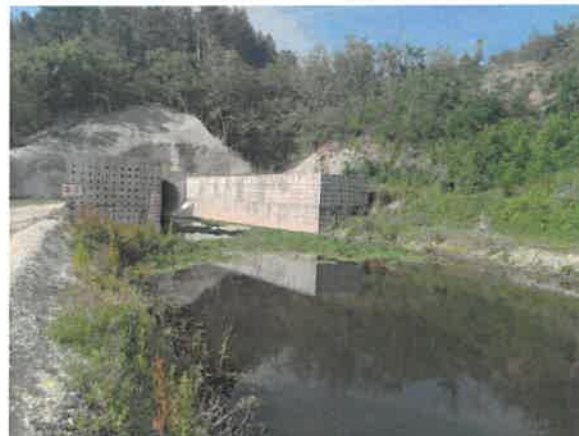
2. Кривелска река пре улаза у тунел