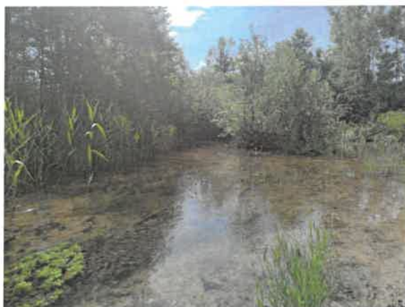
6. Кривелска река (старо корито) пре улива у Борску реку

Дати резултати односе се само на испитане узорке / Извештај се не може умножавати без одобрења управника лабораторије. / Жалбе и рекламације на наш рад можете упутити директору ИРМ Бор.