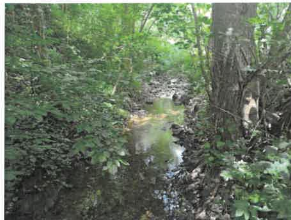
8. Борско језеро – притока Ваља Жони