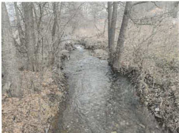
1. Кривељска река након спајања Церове реке и Ваља Маре