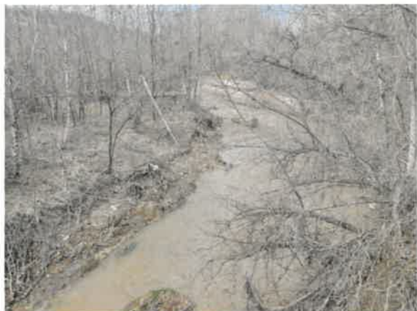
7. Бела река у Заграђу после улива Равне реке