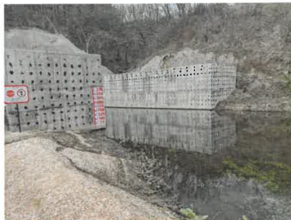
2. Кривељска река пре улаза у тунел