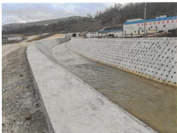
3. Кривељска река после излаза из тунела