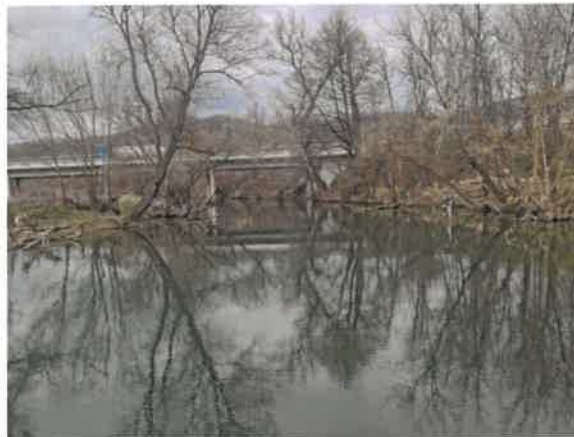
15. Црни Тимок после улива Брестовачке реке