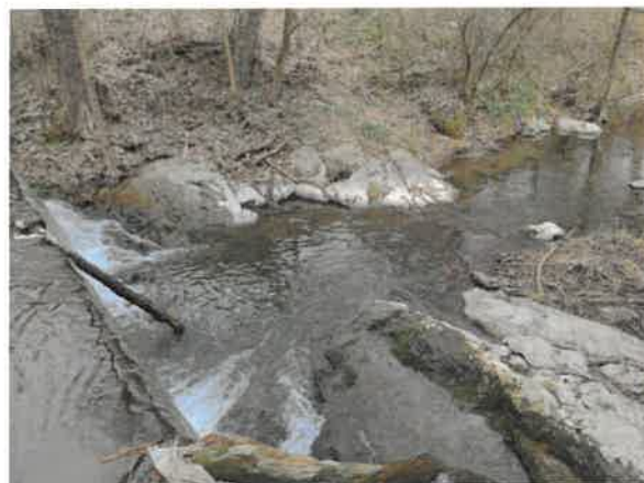
12. Брестовачка река пре Брестовачке бање