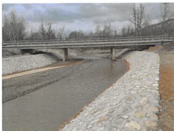
5. Борска река пре улива у Кривељску реку (старо корито)