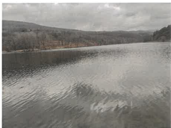
9. Борско језеро – плажа Тропски бар