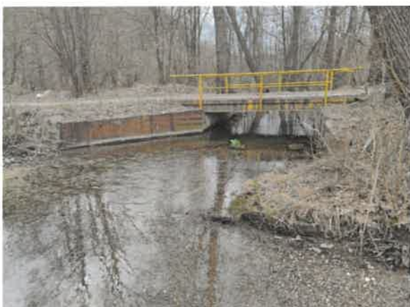
11. Борско језеро – притока Марцова река