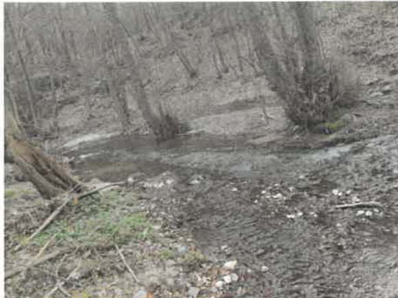
13. Брестовачка река после Брестовачке бање