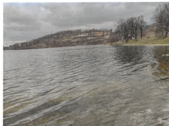
10. Борско језеро – Главна плажа