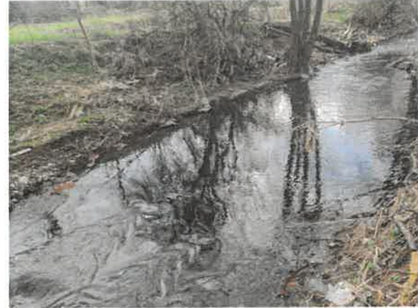
14. Брестовачка река у Дановом Пољу (после нископа)