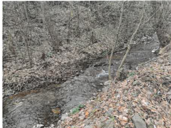
8. Борско језеро – притока Ваља Жони