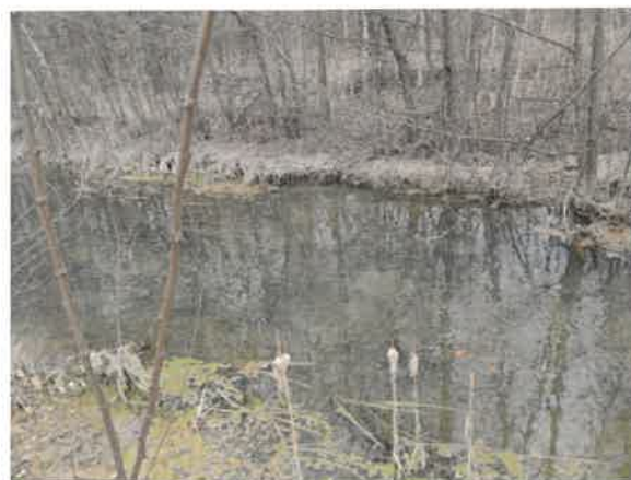
6. Кривељска река (старо корито) пре улива у Борску реку