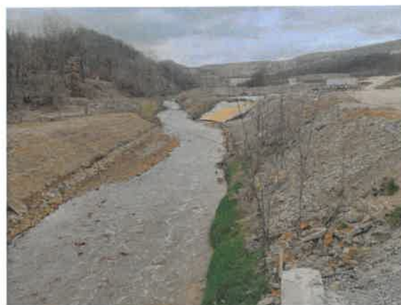
4. Борска река пре улива Кривељске реке из тунела