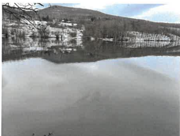
9. Борско језеро – плажа Тропски бар