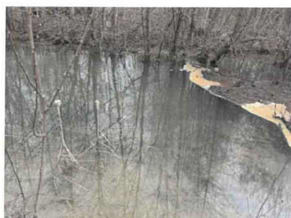
6. Кривевљска река (старо корито) пре улива у Борску реку

Дати резултати односе се само на испитане узорке / Извештај се не може умножавати без одобрења управника лабораторије. / Жалбе и рекламације на наш рад можете упутити директору ИРМ Бор.