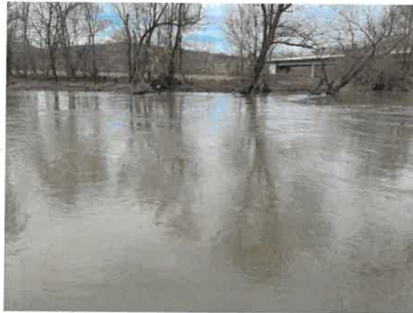
15. Црни Тимок после улива Брестовачке реке