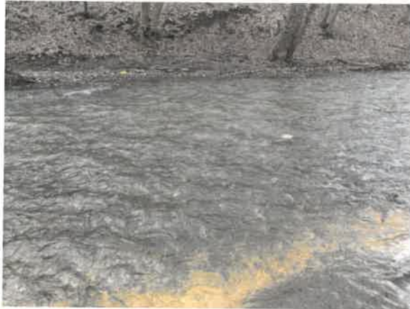
13. Брестовачка река после Брестовачке бање