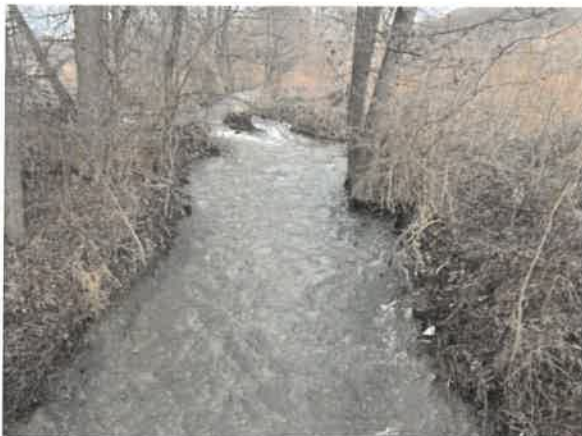
1. Кривевљска река након спајања Церове реке и Ваља Маре