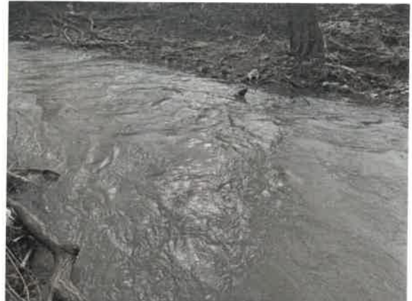
14. Брестовачка река у Цановом Пољу (после нископа)