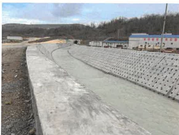
3. Кривевљска река после излаза из тунела