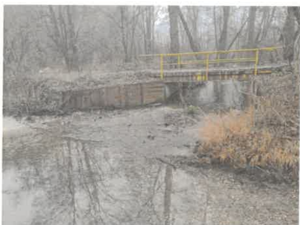
11. Борско језеро – притока Марцова река