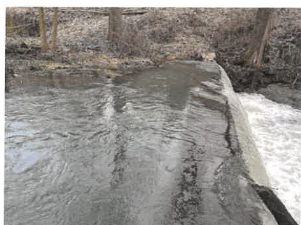
12. Брестовачка река пре Брестовачке бање