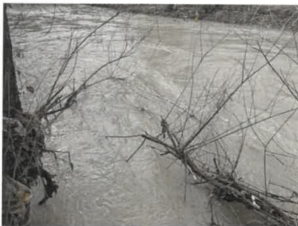
7. Бела река у Заграђу после улива Равне реке