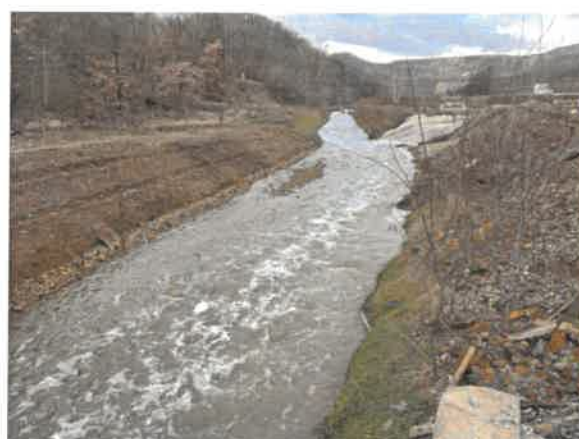
4. Борска река пре улива Кривевљске реке из тунела