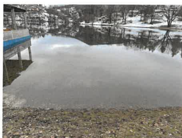
10. Борско језеро – Главна плажа