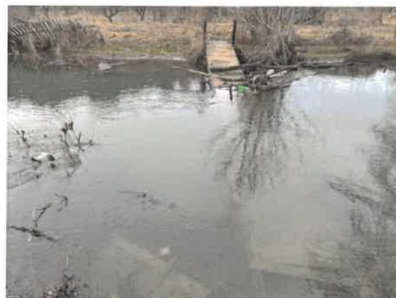
2. Кривевљска река пре улаза у тунел