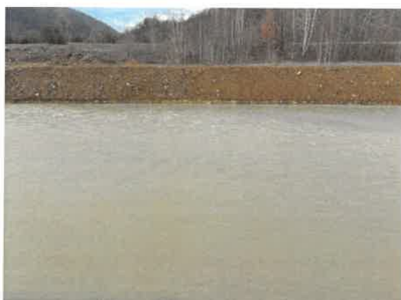
5. Борска река пре улива у Кривевљску реку (старо корито)