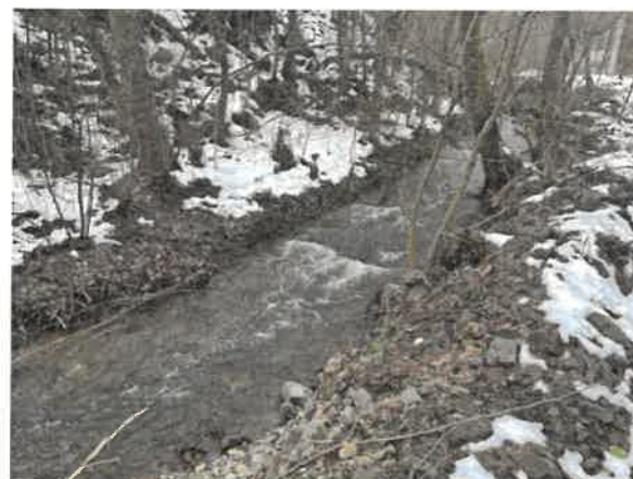
8. Борско језеро – притока Ваља Жони