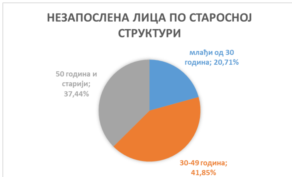
Слика бр. 2.

Незапосленост највише угрожава жене, лица без квалификација, лица са средњим нивоом квалификације и лица од 30 до 50 година старости.