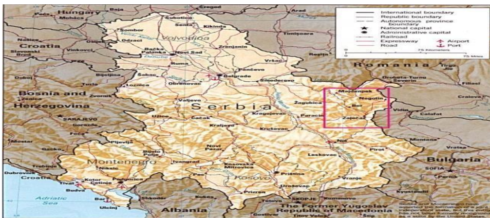
Слика 1. Положај града Бора