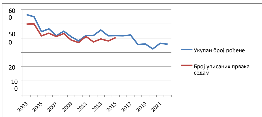
Слика 4. Однос броја рођене деце и броја уписаних у први разред седам година касније на територији града Бора

Како је просечан број рођене деце у десетогодишњем периоду 394, а број уписаних првака седам година касније се скоро не разликује од наведеног, прогноза броја уписаних првака за наредни период је 390-400 детета.