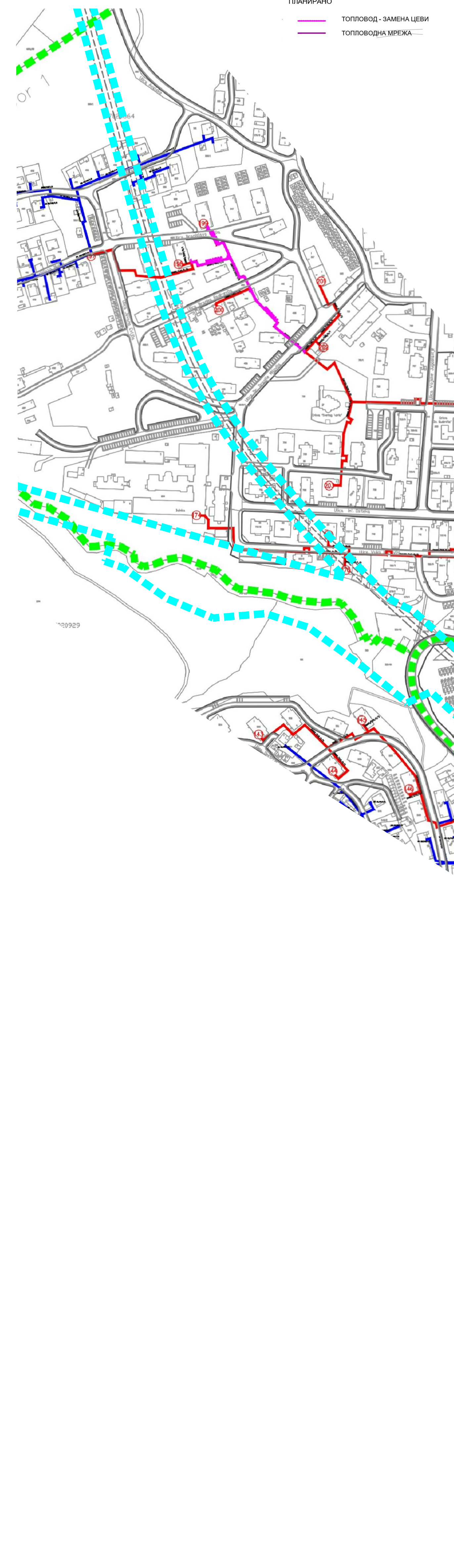
Карта бр.9.: Топловодна мрежа и објекти